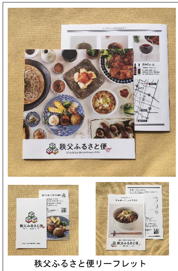
秩父ふるさと便リーフレット